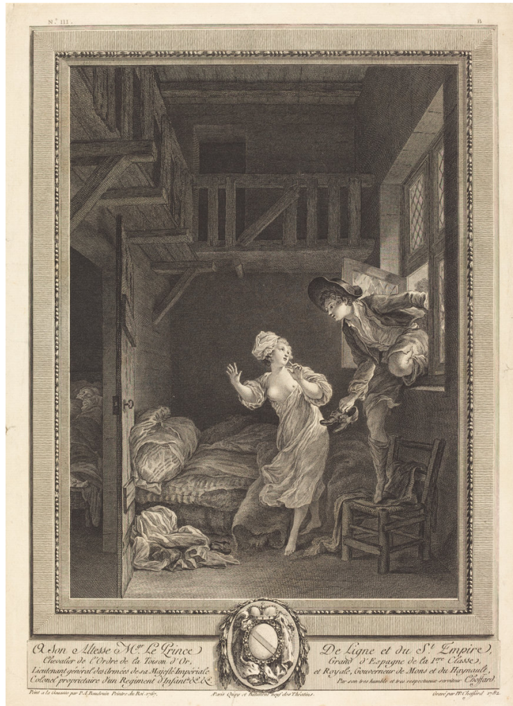
Figure 1 : Pierre-Philippe Choffard, d'après Pierre-Antoine Baudouin, Marchez tout doux, parlez tout bas, ou La Fille mal gardée , 1782, gravure à l'eau forte. Avec la permission de la National Gallery of Art, Washington

Marine Ganofsky Université de Saint Andrews (Royaume Uni)