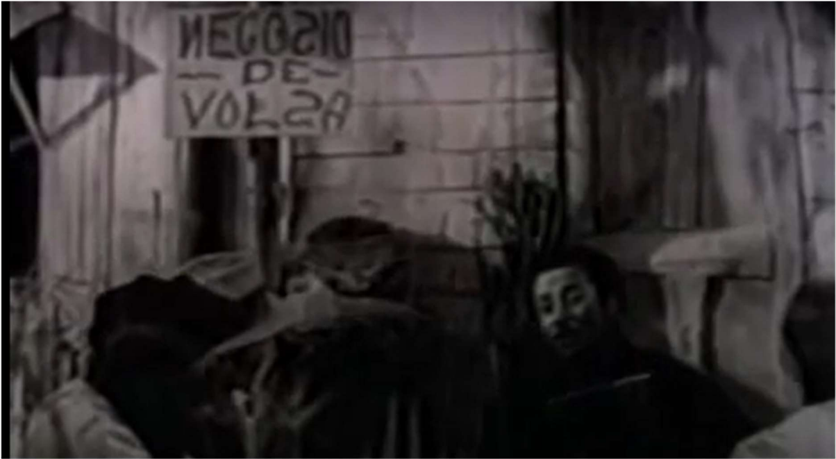
Figure 26: 'Wall Street', as depicted in the 1936 film Puerto Nuevo .