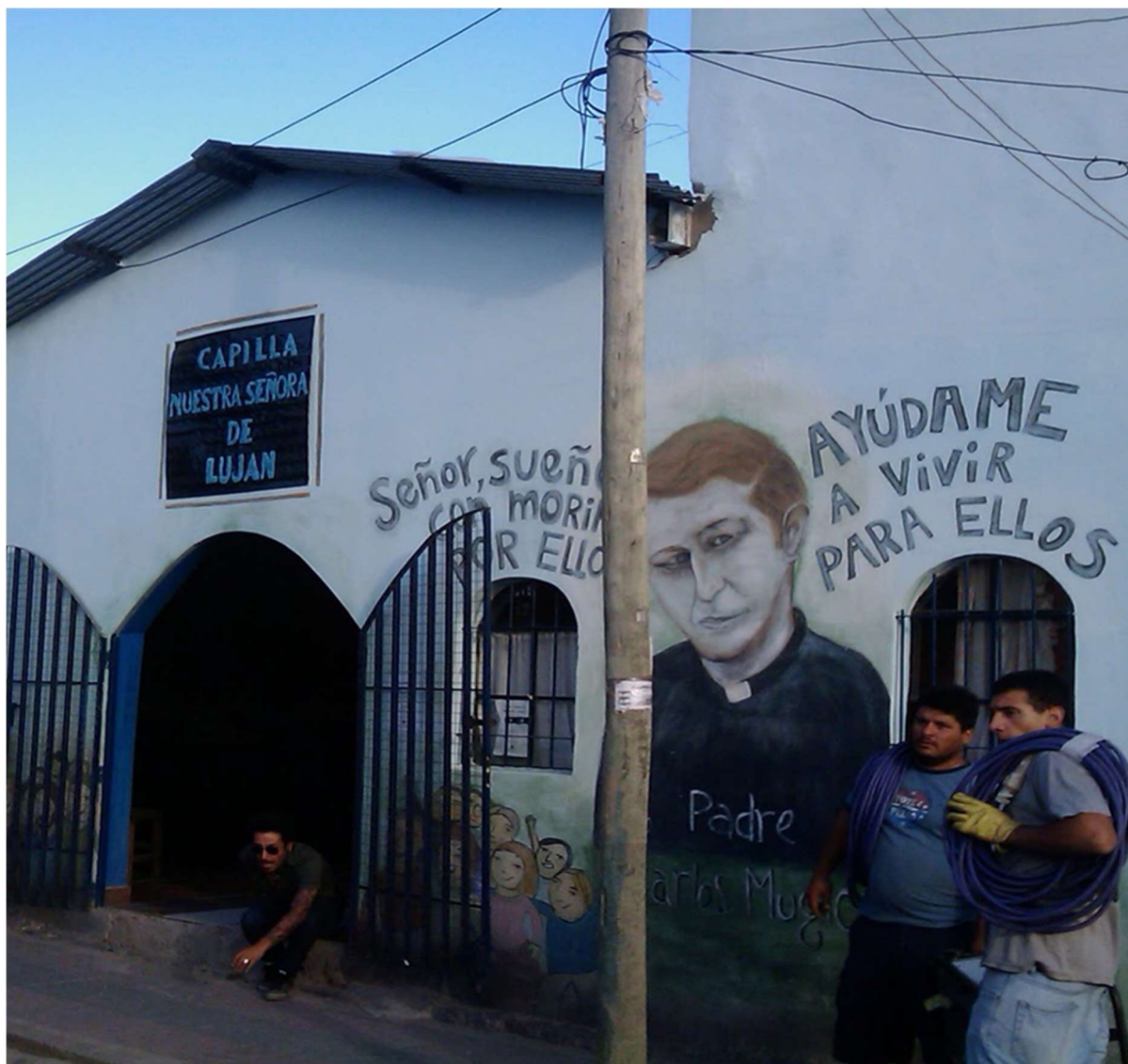
Figure 28: The chapel in Elefante blanco .