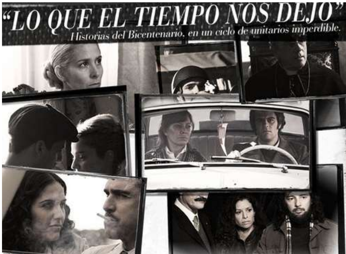
Figure 31: Promotional poster for the 2010 mini-series, Lo que el tiempo nos dejó .