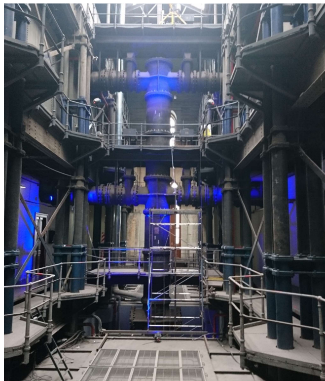
Figure 14: Interior of the Palacio de las aguas corrientes, Buenos Aires.