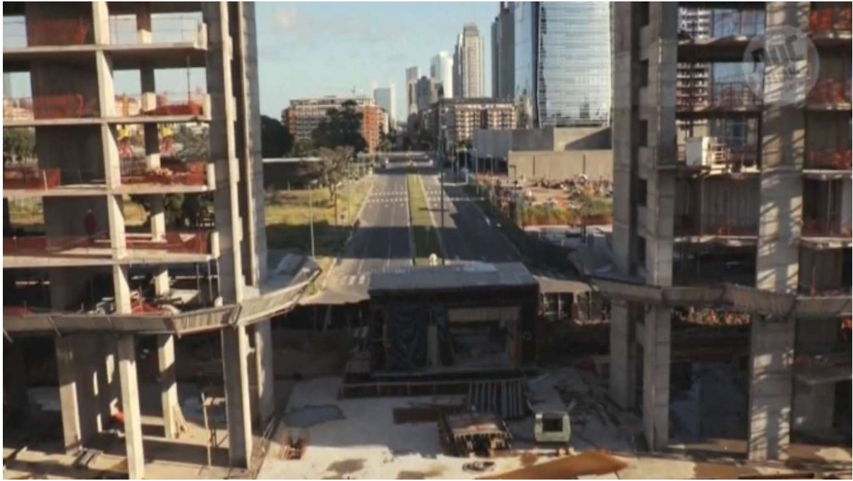
Figure 22: The construction site in Puerto Madero.