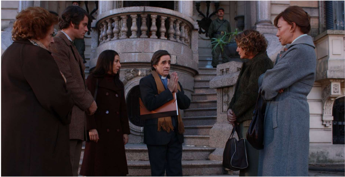
Figure 35: The mothers in their outdoor clothing in episode 3 of Lo que el tiempo nos dejó .