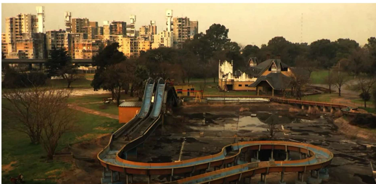
Figure 18: The ruined landscapes of the Interama theme park in La multitud .