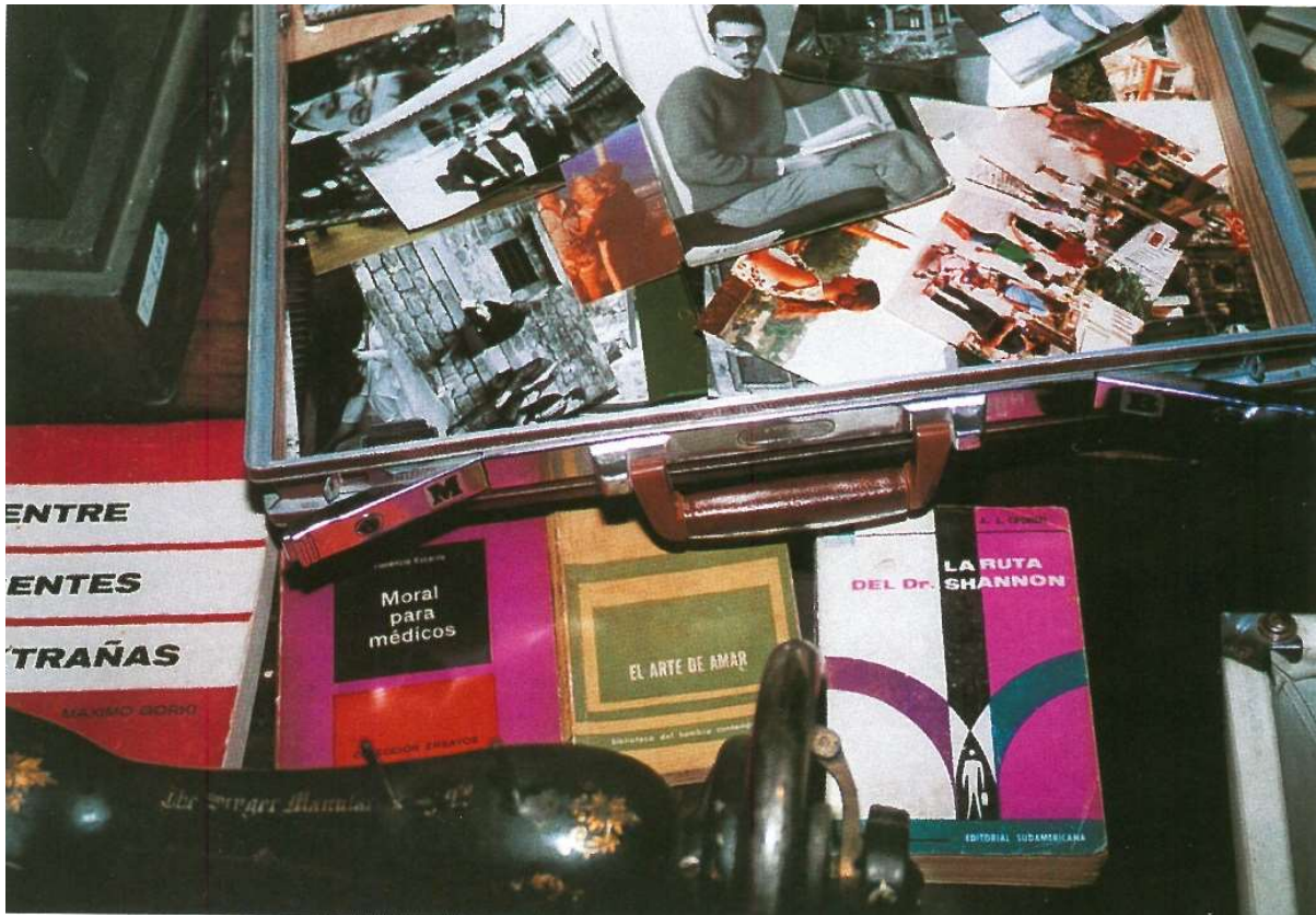
Figure 33: Photographs from the installation 'El pañol', in Marcelo Brodsky. Image: Marcelo Brodsky.