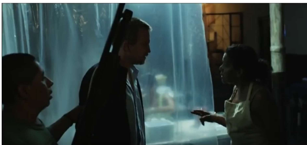
Figure 29: Padre Nicolás enter's Carmelita's narcotics lab in Elefante blanco . Image: Youtube.