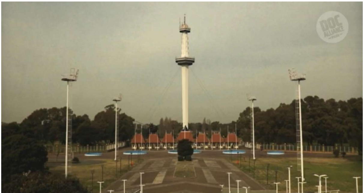
Figure 23: The Tower of the Future by day.