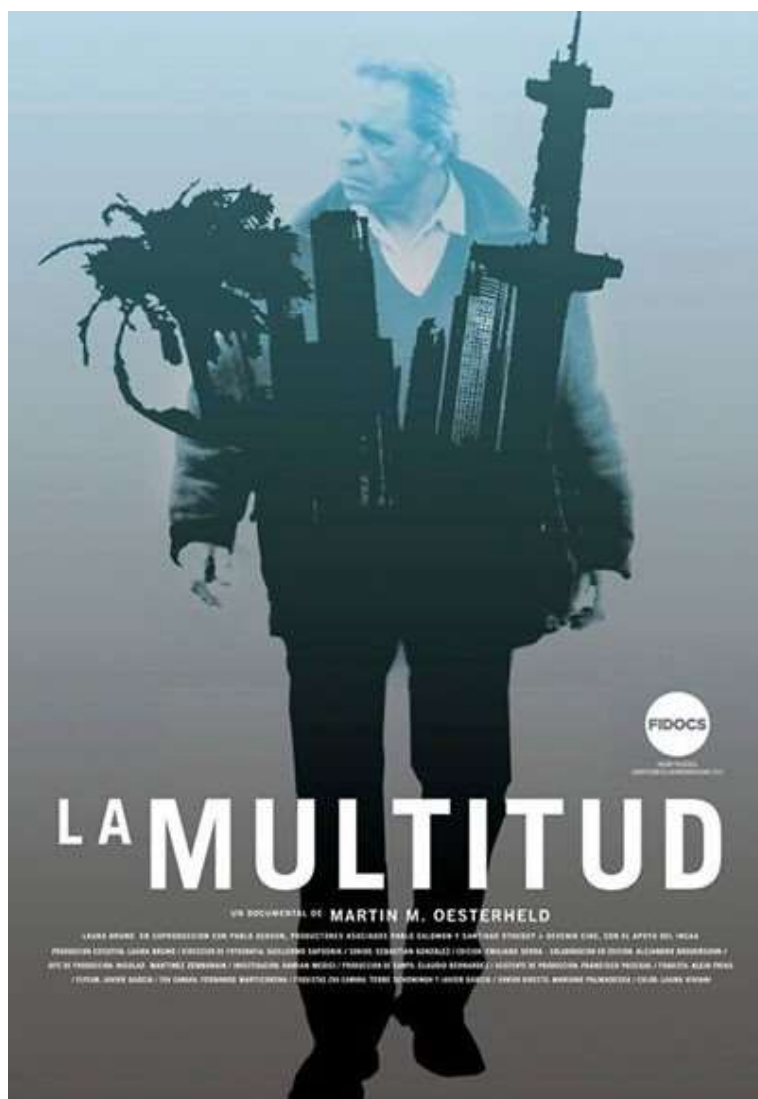
Figure 16: Promotional poster for La multitud .