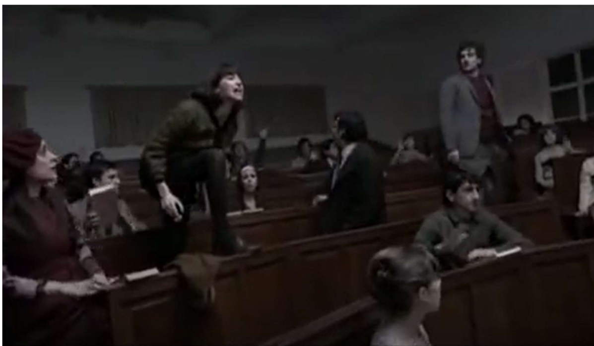
Figure 38: The students sing the national anthem in episode 2 of Lo que el tiempo nos dejó .