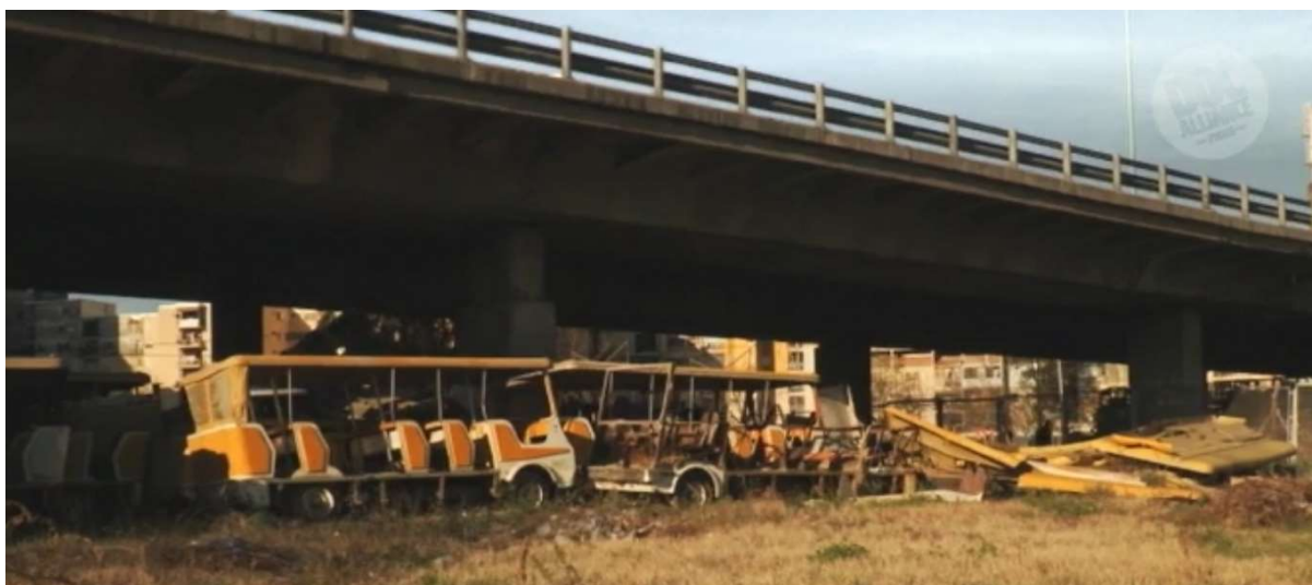
Figure 19: The derelict remains of themepark rides under a motorway flyover in La multitud . Image: DA Films.