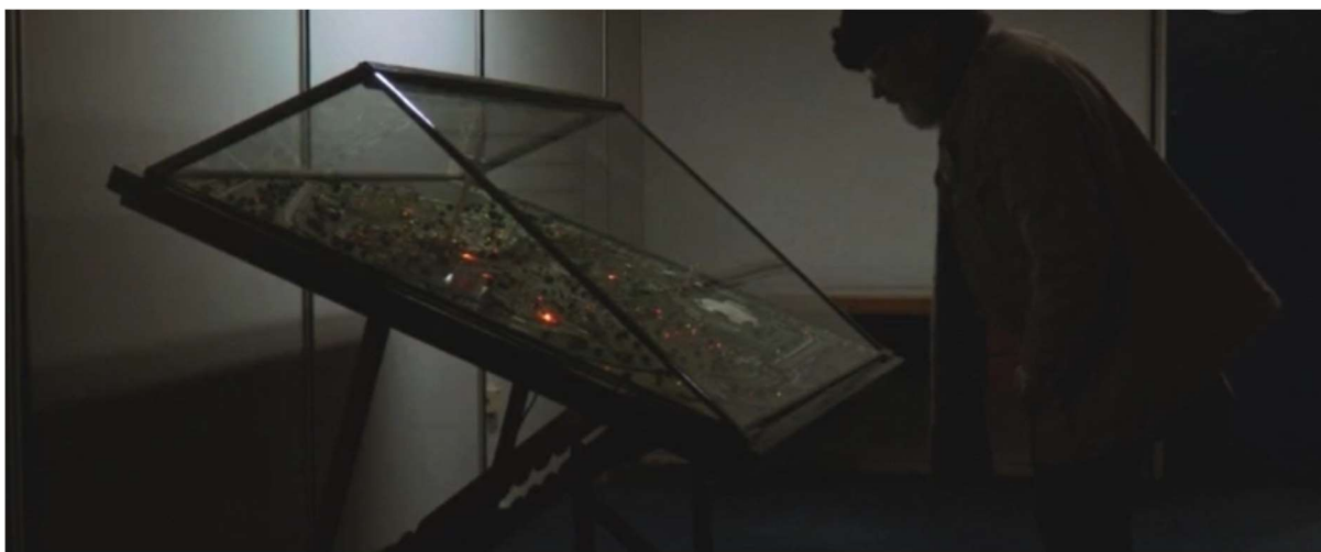
Figure 17: The diorama of the Interama theme park, in La multitud .