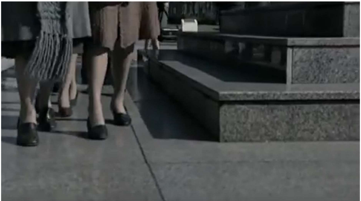
Figure 36: The mothers, walking around the monument in the Plaza de Mayo in episode 3 of Lo que el tiempo nos dejó .