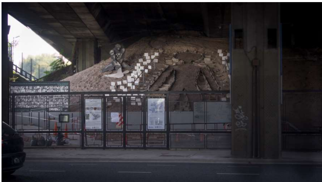
Figure 15: The former clandestine detention centre Club Atlético, Buenos Aires.