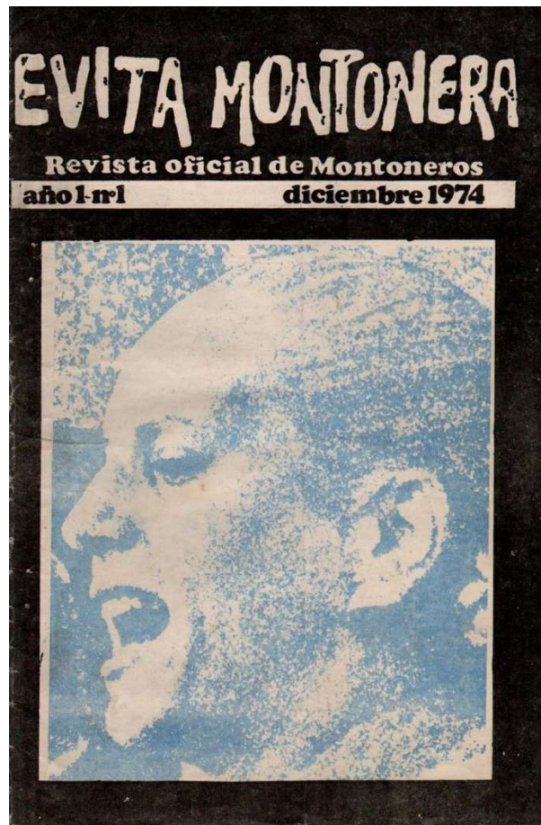
Figure 40: Evita Montonera , the magazine of the Montoneros.