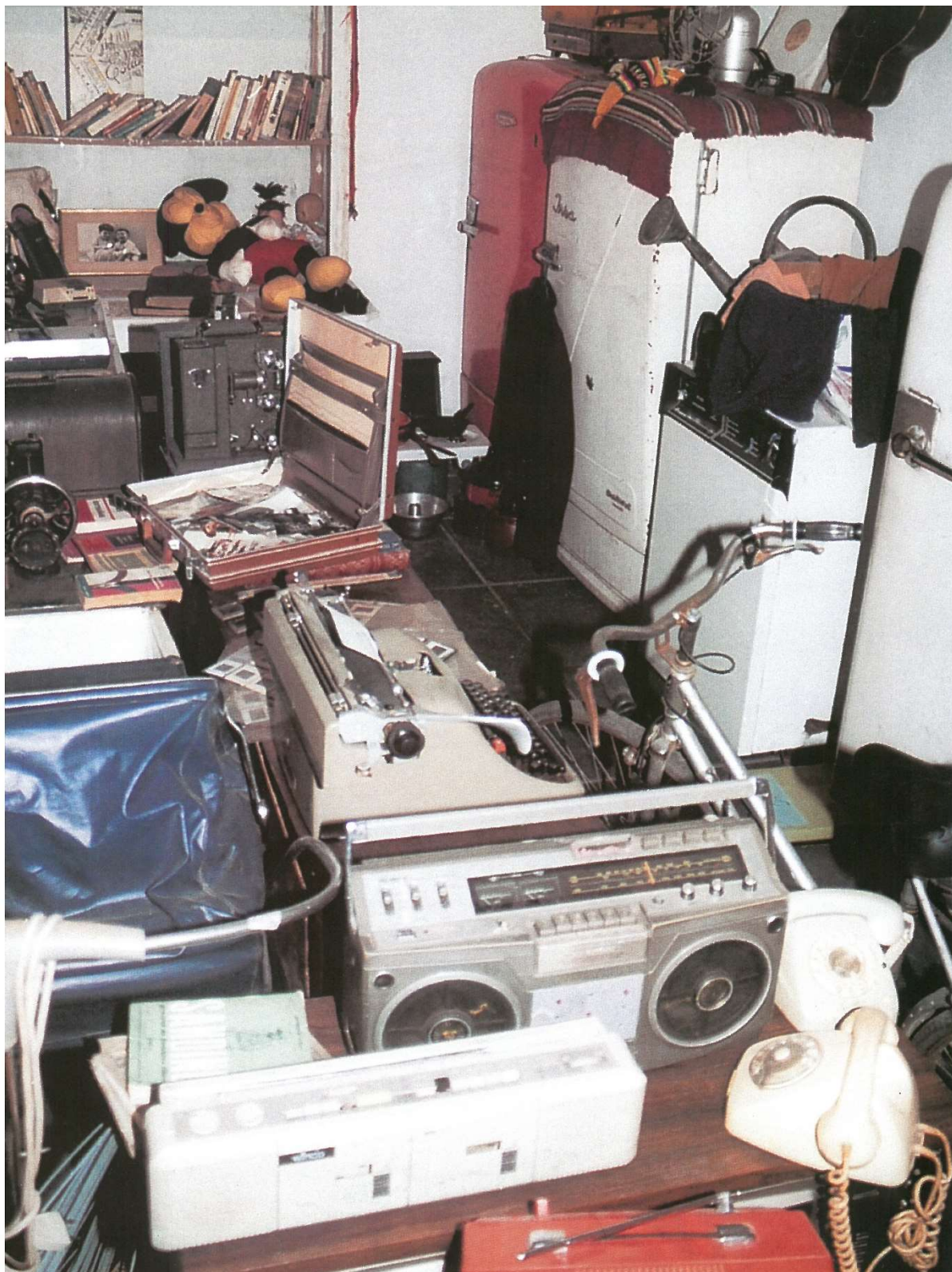
Figure 32: Photograph from the 1999 installation 'El pañol', by Marcelo Brodsky.