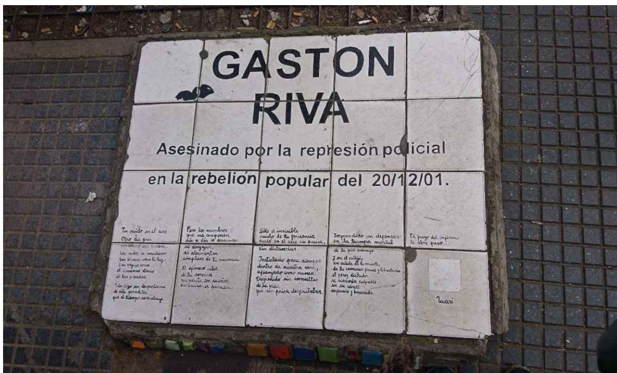
Figure 4: A baldosa dedicated to the memory of Gastón Riva, one of five men killed in and around the Plaza de Mayo on 20 December 2001.