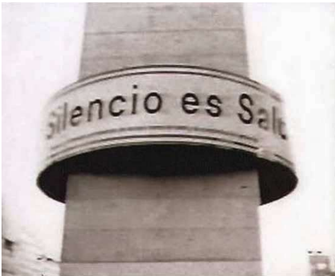
Figure 122: A wider view of the 'silencio es salud' placard that adorned the Obelisk.