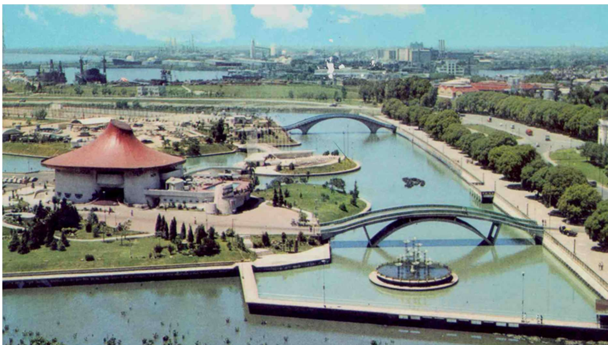
Figure 20: A photograph of the Ciudad Deportiva, during its construction in the mid-1970s.