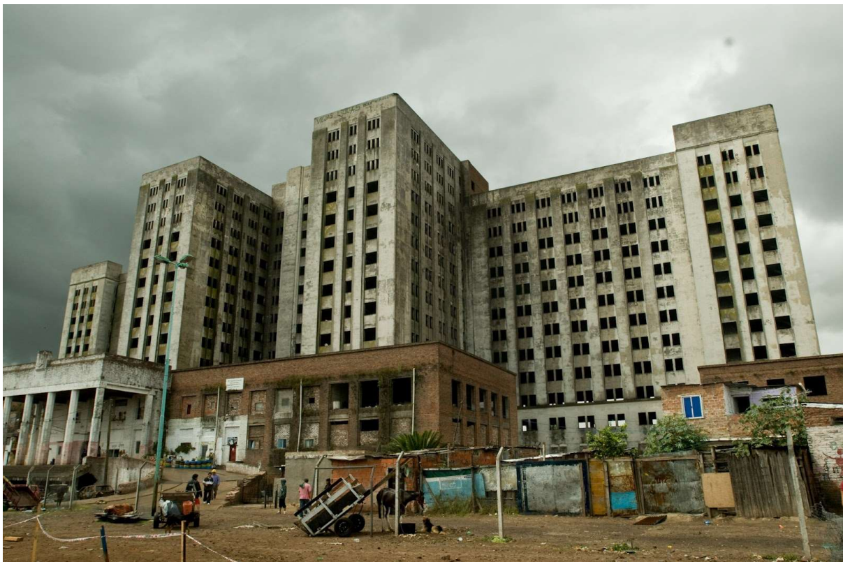
Figure 25: The ruined hospital in Ciudad Oculta, Buenos Aires. Image: Página12 .