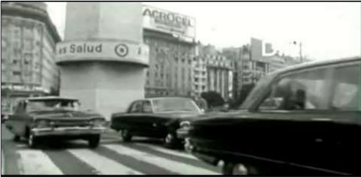
Figure 111: The Obelisk, Avenida 9 de Julio, Buenos Aires, late 1975. A municipal government campaign against excessive traffic noise advises motorists that 'silencio es salud'.