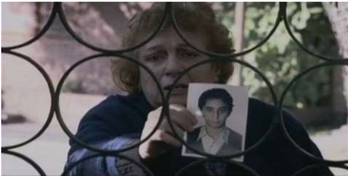
Figure 34: A mother searches for her lost child in episode 3 of Lo que el tiempo nos dejó .