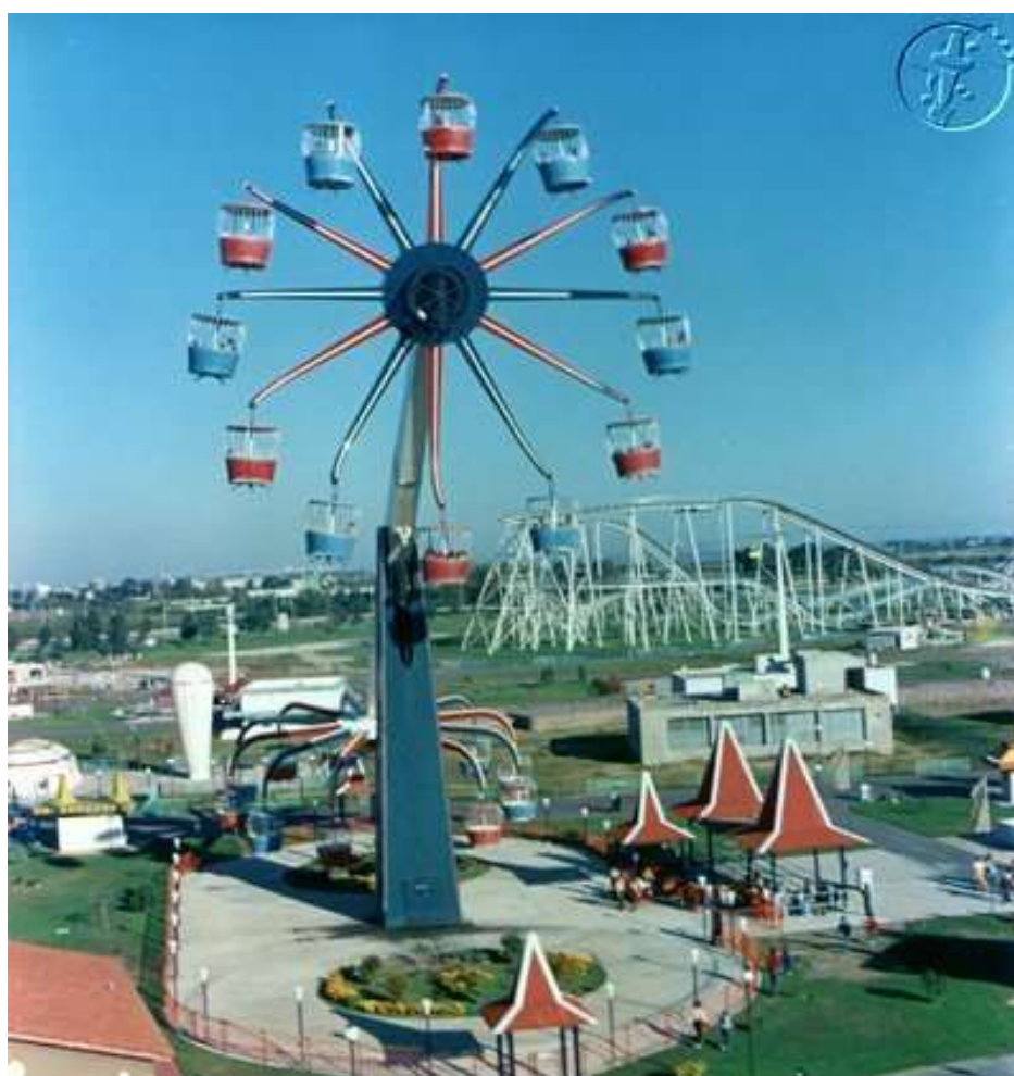
Figure 21: An image of Interama, shortly after its official opening in 1982.