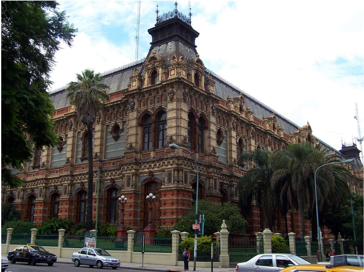
Figure 13: Palacio de las aguas corrientes, Buenos Aires.