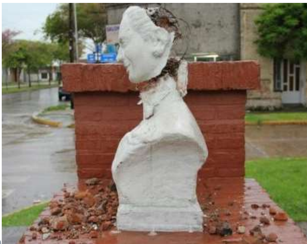
Figure 42: A vandalized bust of Eva Perón, Rosario, Argentina.