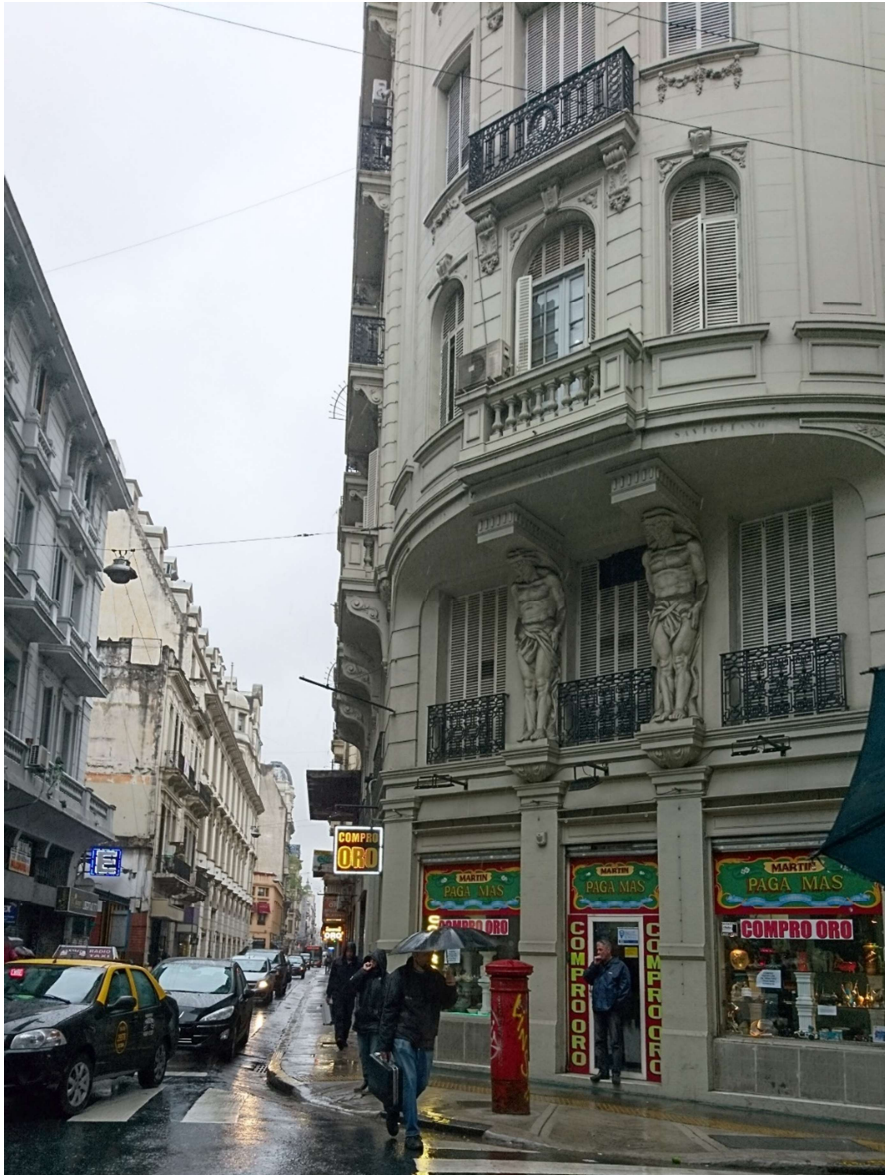
Figure 9: Calle Libertad, a typical central Buenos Aires streetscape.