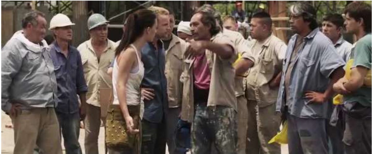
Figure 30: The villeros congregate on the building site in Elefante blanco .