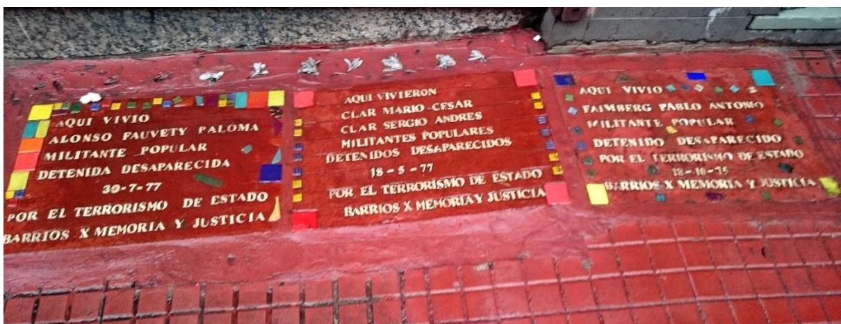
Figure 2: A commemorative baldosa in the San Telmo district, Buenos Aires.