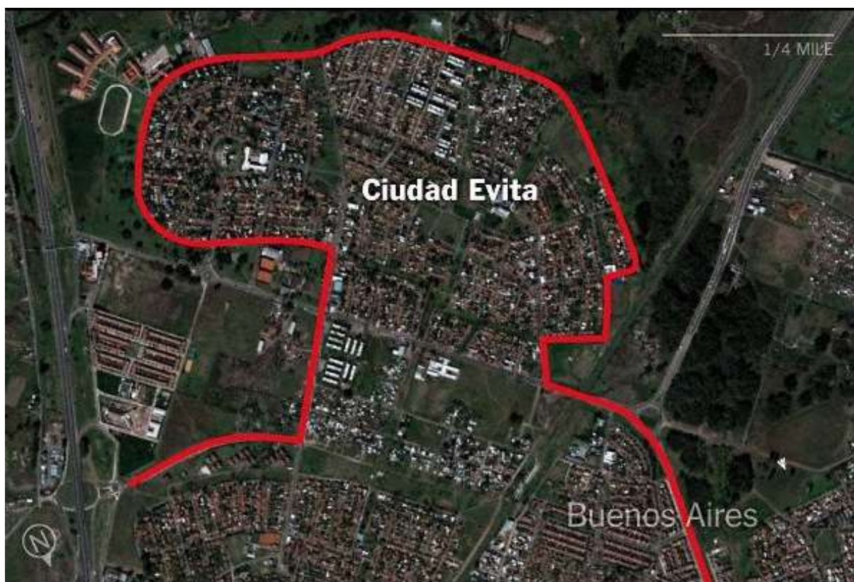
Figure 41: Ciudad Evita, the town in greater Buenos Aires built in the image of Eva Perón's profile.