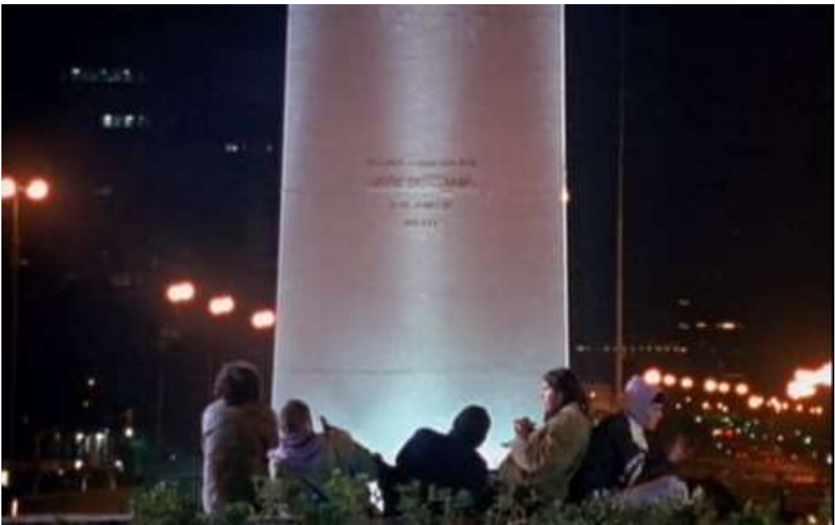
Figure 27: The obelisk, as depicted in the 1998 film Pizza, birra, faso .