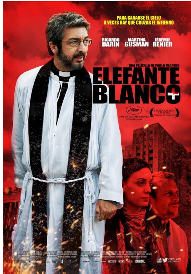
Figure 24: Promotional poster for Elefante blanco .