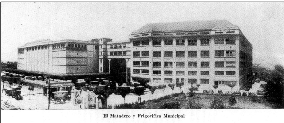
Figure 10: Municipal slaughterhouse, Liniers, Buenos Aires, 1931.