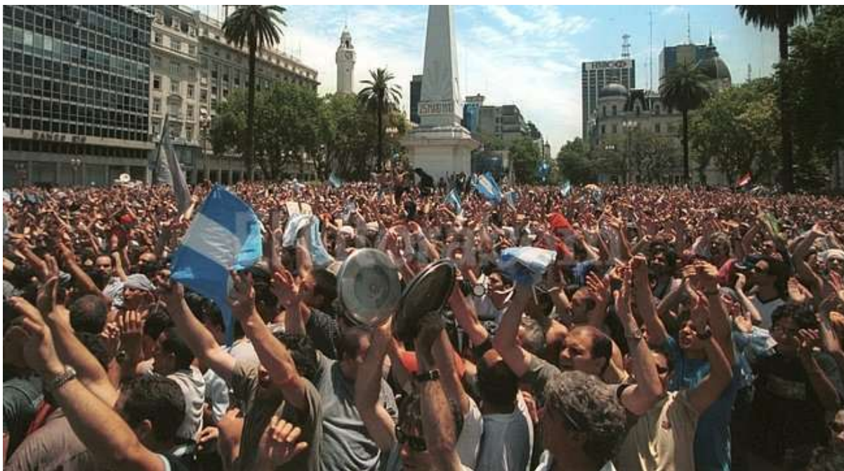
Figure 3: Scenes of protest in the Plaza de Mayo on 20 December 2001.